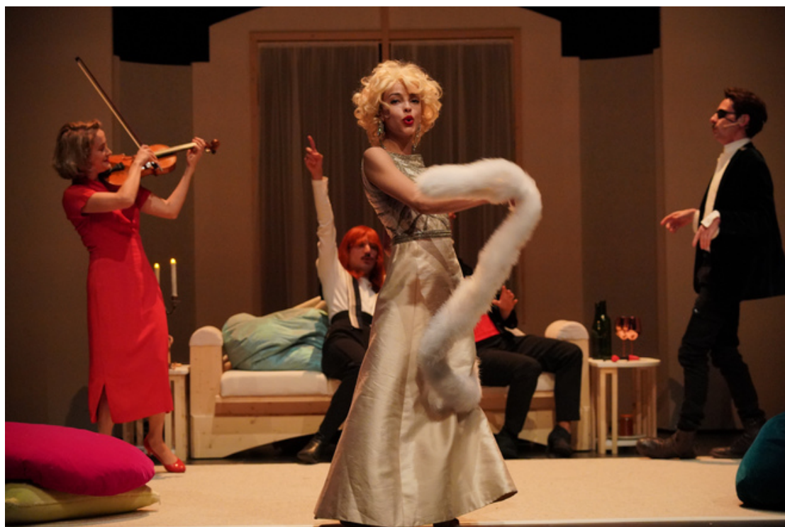
Scène de "A bright room called day"

Tony Kushner a écrit « A bright room called day » en 1985, sous Reagan. Il la modifie et s'apprête à la mettre en scène sous Trump. Catherine Marnas crée la première mondiale de cette nouvelle version à Bordeaux. Passionnant.