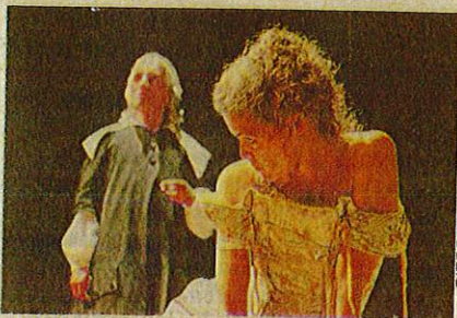
« Sganarelle » et consorts, un jeu de « qui trompe qui » monté sur tréteaux.