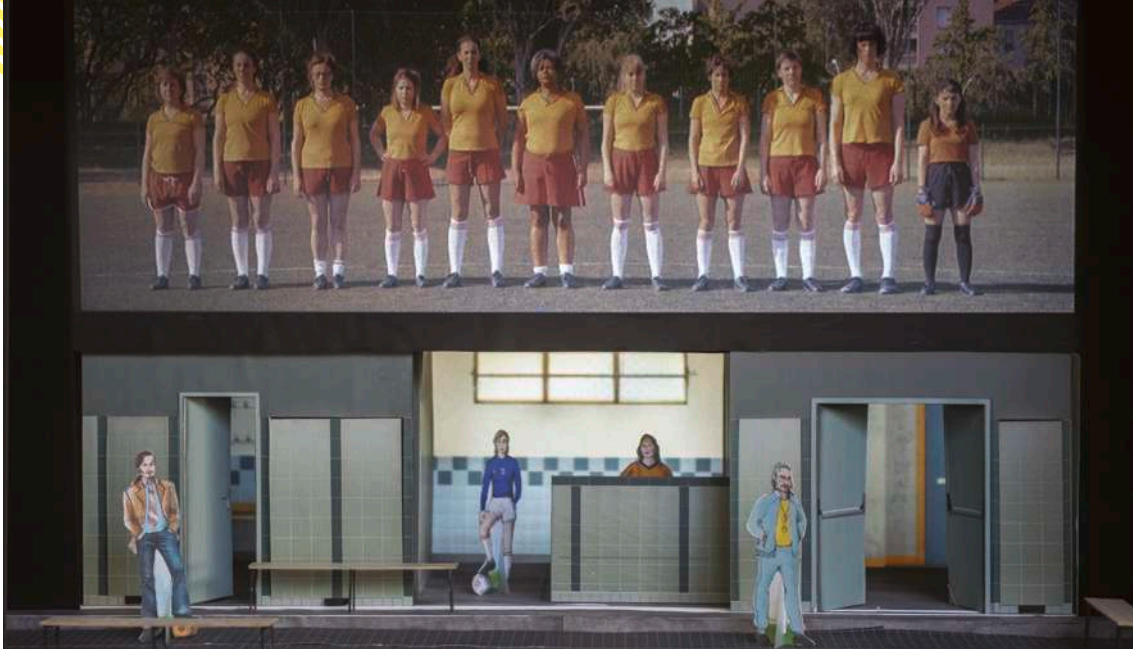
Photo de la maquette du décor, septembre 2019.