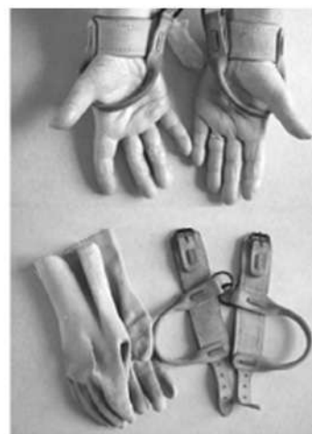
Extrait de Fanny Gallot, En découdre , La Découverte, 2015.