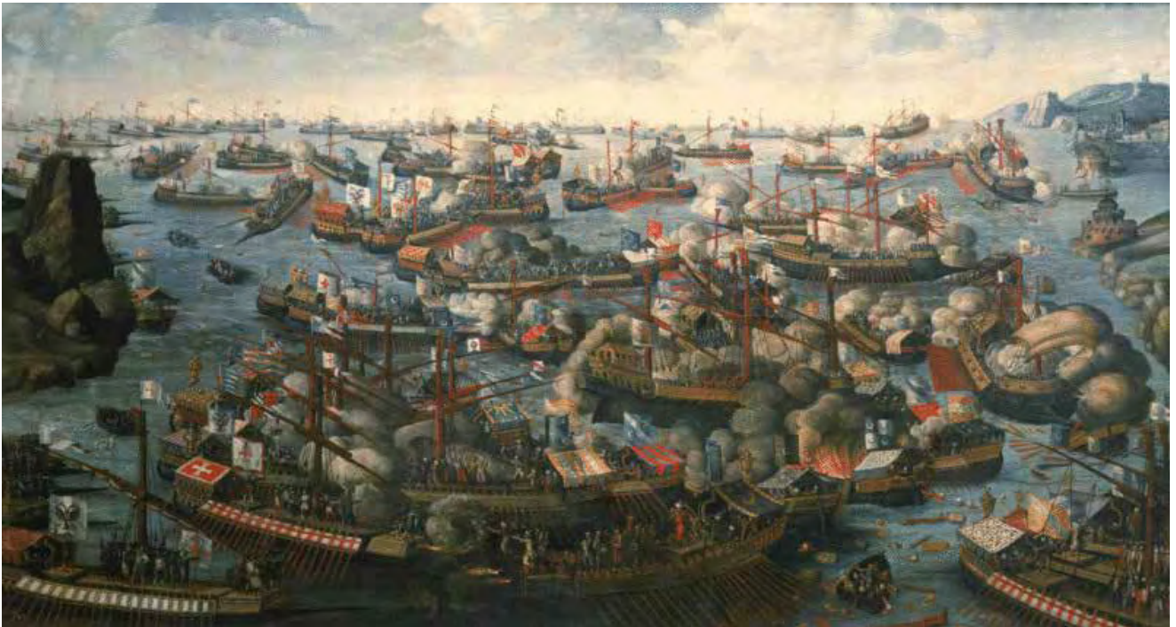
La bataille de Lépante 07/10/1571 - artiste inconnu fin XVIème - (127 cm x 232 cm) National Maritime Museum, Greenwich/London

La bataille de Lépante est la bataille légendaire entre Orient et Occident, qui préfigura le déclin de l'empire Ottoman.