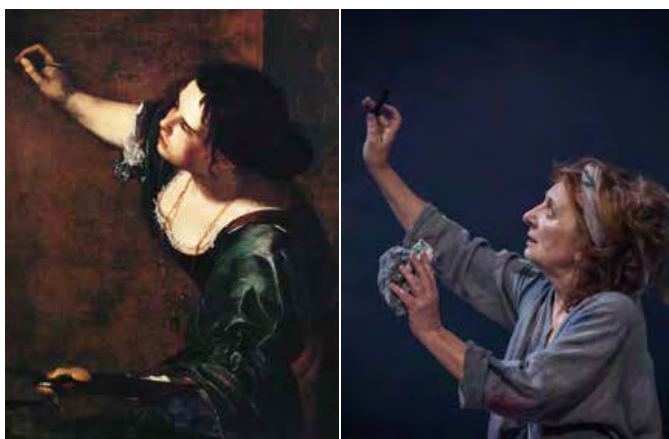
Autoportrait en Allégorie de la peinture 1638-1639, Royal Collection, Windsor

Artemisia Gentileschi est la peintre inspiratrice du personnage de Galactia dans Tableau d'une exécution . Née en 1593, elle est issue de l'école caravagesque du XVII e siècle et sa vie, marquée par des épisodes dramatiques, s'apparente à un combat permanent pour faire reconnaître son talent et sa place dans un milieu réservé aux hommes. Contrairement à une idée répandue, Artemisia Gentileschi n'est pas la première femme peintre reconnue dans l'histoire de l'art. Depuis le XVI e siècle, où le statut de l'artiste est sorti du cadre de l'artisanat anonyme pour devenir celui d'un « travailleur intellectuel » nommément reconnu, de nombreuses femmes ont exercé l'art de la peinture, notamment en Flandre et en Italie. Mais Artemisia est sans doute la première à avoir acquis une notoriété comparable à celle d'artistes masculins, tant en raison de son talent que des événements qui ont marqué sa carrière