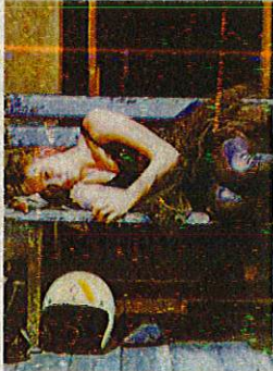
« À la renverse », par le Théâtre du Rivage.