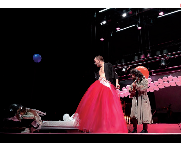
2 : Le Comte entend confondre le page, qu'il croit enfermé dans le cabinet de la Comtesse.