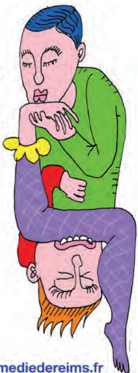
L'affiche du Mariage de Figaro . © La Comédie de Reims