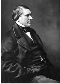
Labiche photographié par Nadar © droits réservés