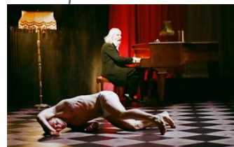
A Louer (2011)

La compagnie s'est ouverte depuis peu à de nouvelles collaborations inspirantes avec d'autres artistes, compagnies et théâtres. En 2013, Gabriela Carrizo a créé la pièce courte The missing door avec et pour les danseurs du Nederlands Dans Theater (NDT I), tandis que Franck Chartier a adapté 32 rue Vandenbranden pour l'Opéra de Göteborg ( 33 rue Vandenbranden , 2013).