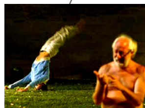
Le Jardin (2002)

Au moyen de techniques de montage de film, ils parviennent à repousser les limites d'un récit sur lequel on ne peut mettre le doigt. Le huis clos de situations familiales reste pour Peeping Tom une source importante