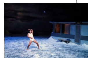
32, rue Vandenbranden (2009)