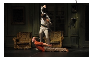
Le Salon (2004)