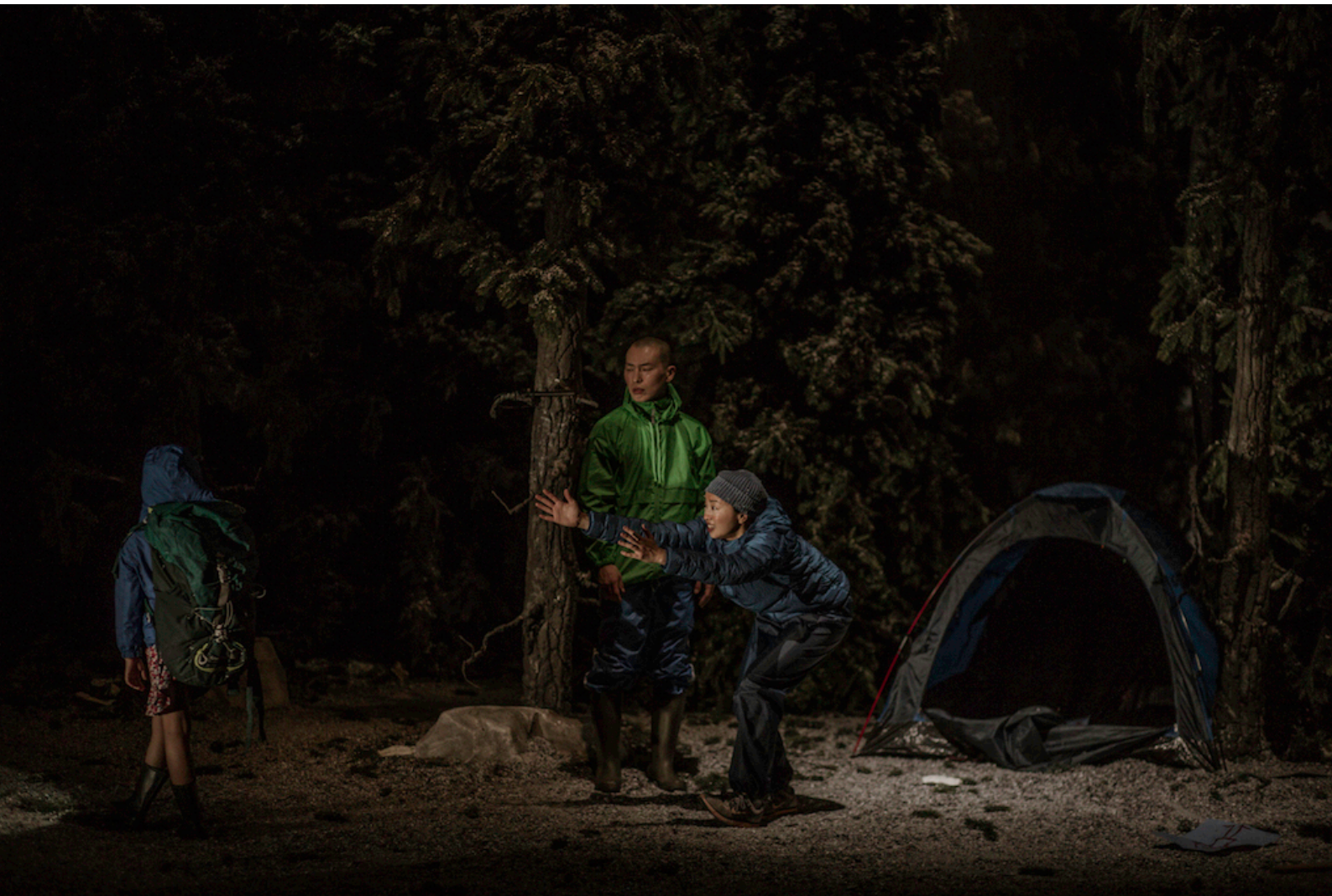
Kind, © Virginia Rota, Peeping Tom