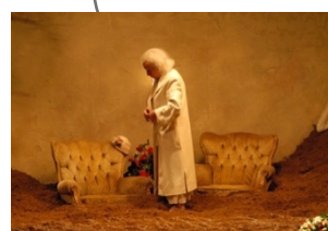
Le Sous Sol (2007)