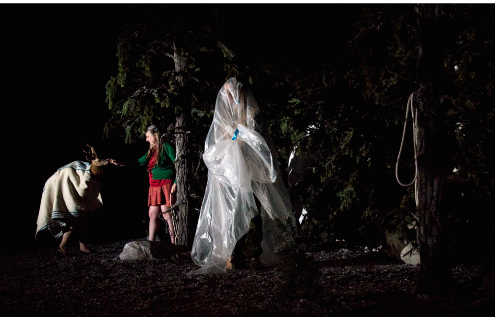
Kind, © Oleg Degtiarov, Peeping Tom