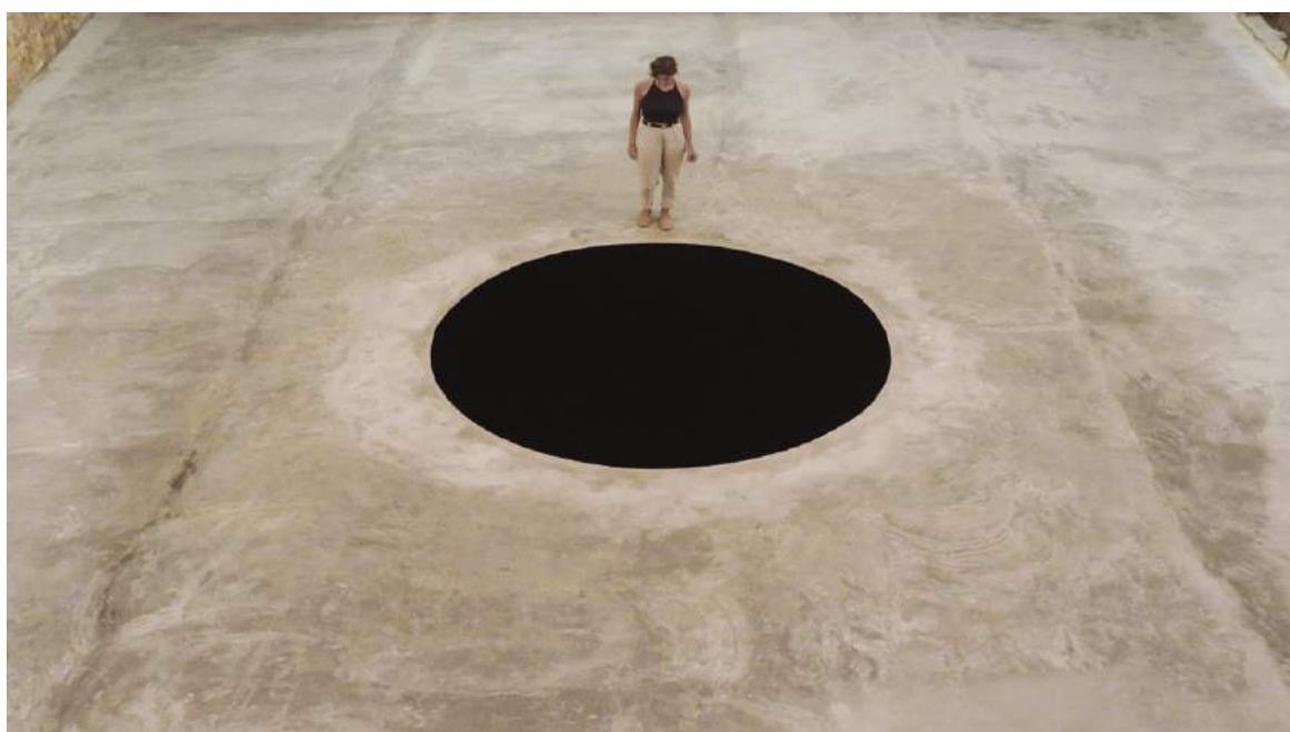
Descent Into Limbo Anish Kapoor