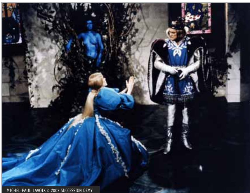
MICHEL-PAUL LAVOIX © 2003 SUCCESSION DEMY

Dans ces images, Peau d'âne est présentée dans une position inférieure, soit agenouillée, placée en dessous de son père, lui-même la jugeant de toute sa haute stature pour Demy, soit acculée dans un coin du château tandis que la