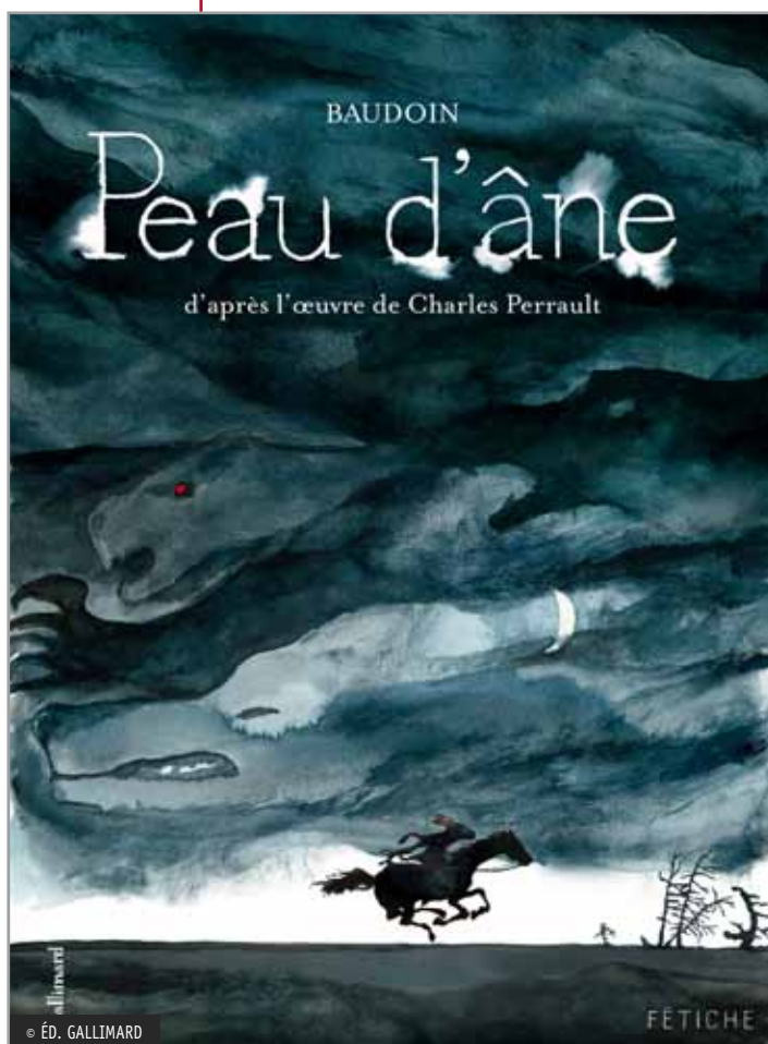
Peau d'âne d'après l'œuvre de Charles Perrault, Baudoïn, Gallimard, « Fétiche », 2010.

Dans ces images, la puissance du père et la menace qu'il représente sont rendues par le rapport de grandeur et de petitesse. Dans l'illustration ci-dessus, Peau d'âne est acculée dans un coin, encerclée par les conseillers et par la figure dominatrice du père, tandis que pour l'illustration ci-contre, le ciel nuageux dessine au-dessus d'elle des formes de monstres terrifiants. Cependant les couleurs orange, blanche et beige dominent la première image et atténuent ainsi l'inquiétude. Dans la seconde image, la course du cheval est inverse à celle des nuages, et la fuite s'effectue dans une large bande blanche qui se poursuit « hors dessin ». Le dessin inquiète et rassure donc en même temps. Sachant qu'au théâtre la présence réelle des acteurs est plus frappante encore, l'adaptation se doit d'inventer des procédés spécifiques, pour retrouver la magie originelle du conte, qui « réside dans sa capacité à transformer la souffrance en plaisir. En donnant corps aux fantômes de notre imagination sous forme d'ogres, de sorcières, de cannibales et de géants, les contes de fées suscitent l'effroi, pour le voir aussitôt vaincu par le plaisir de sa représentation 10 ».