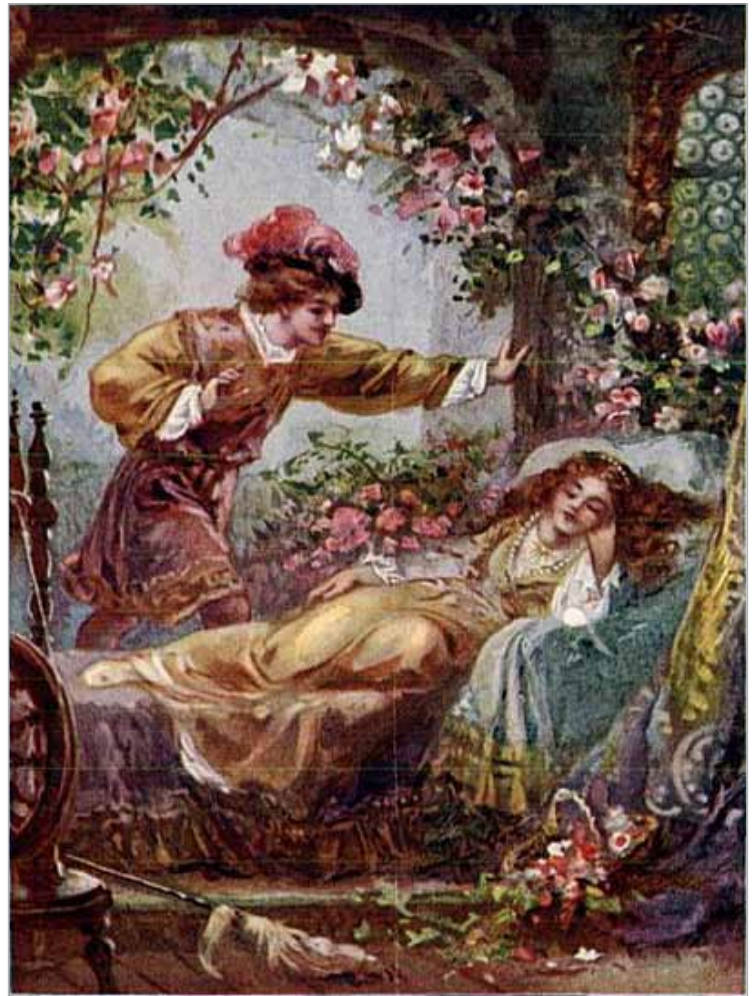
PRINCE FLORIMOND FINDS THE SLEEPING BEAUTY