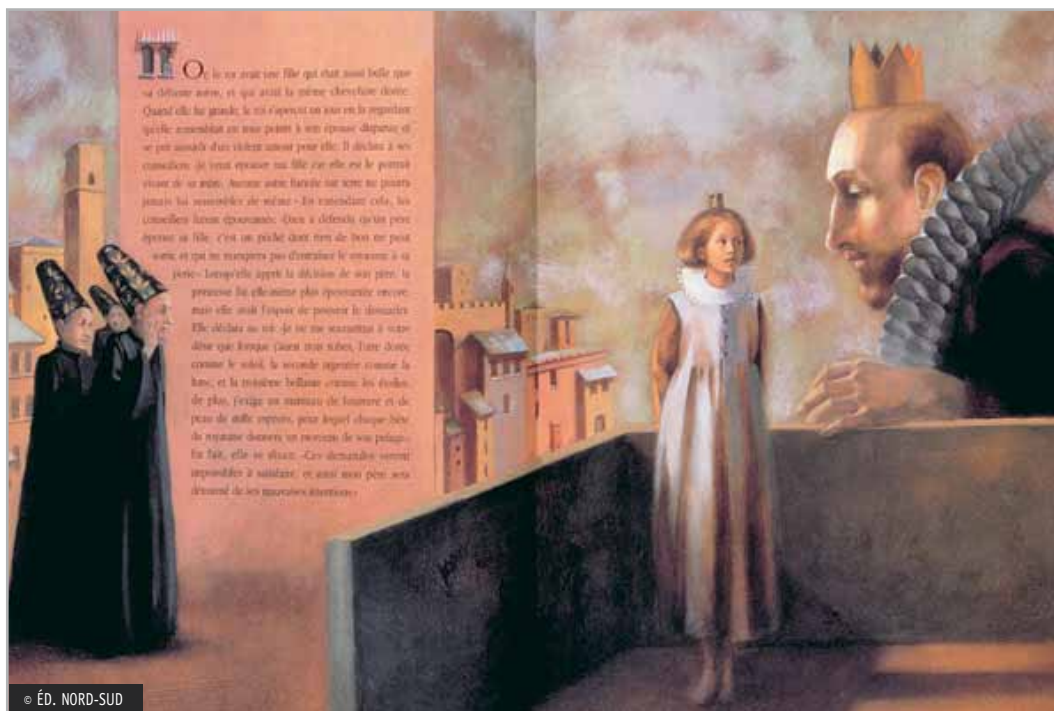
Illustration d'Henriette Sauvart pour Mille-Fourrures de Grimm, édition Nord-Sud, 1997.