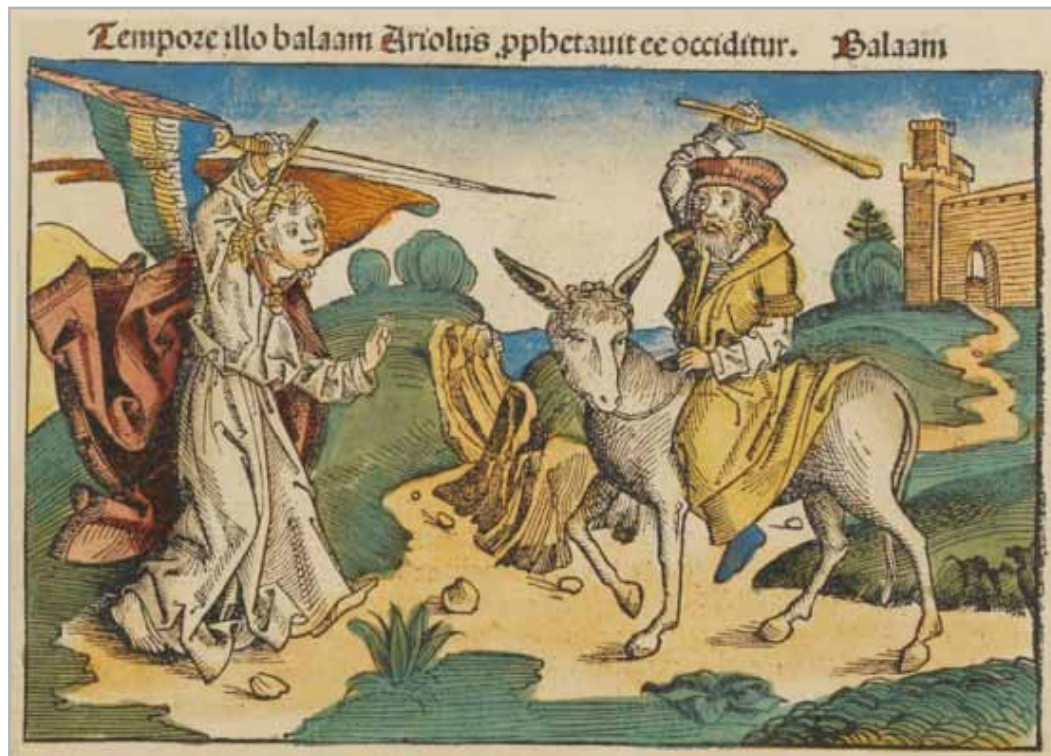
Balaam et l'ange. Die Schedelsche Weltchronik de H. Schedel (1493).

[23] L'ânesse vit l'ange de l'Éternel qui se tenait sur le chemin, son épée nue dans la main ; elle se détourna du chemin et alla dans les champs. Balaam frappa l'ânesse pour la ramener dans le chemin.