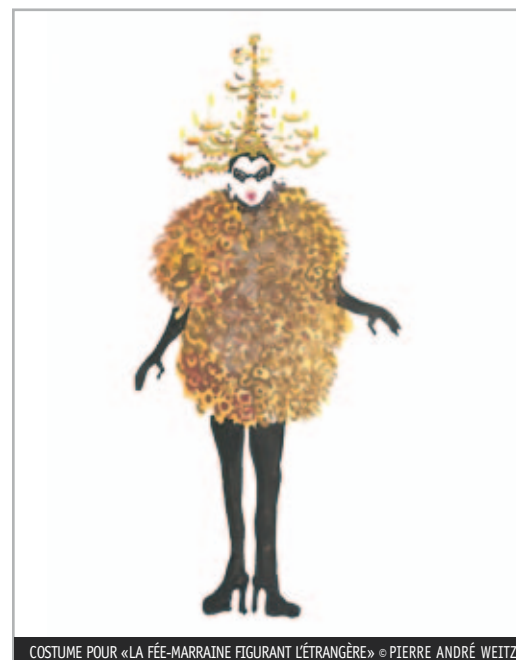
COSTUME POUR « LA FÉE-MARRAINE FIGURANT L'ÉTRANGÈRE » © PIERRE ANDRÉ WEITZ

Le tout affiche une théâtralité un peu cheap 15 : on pense à un théâtre forain, au cirque ambulant, à la manière même dont les enfants improvisent un décor pour leurs jeux. Les caddies servent de