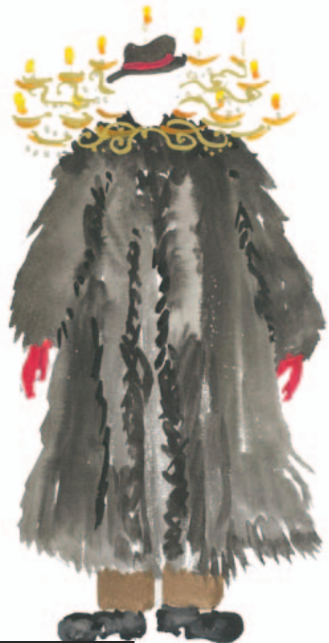
COSTUME POUR LE ROI © PIERRE ANDRÉ WEITZ