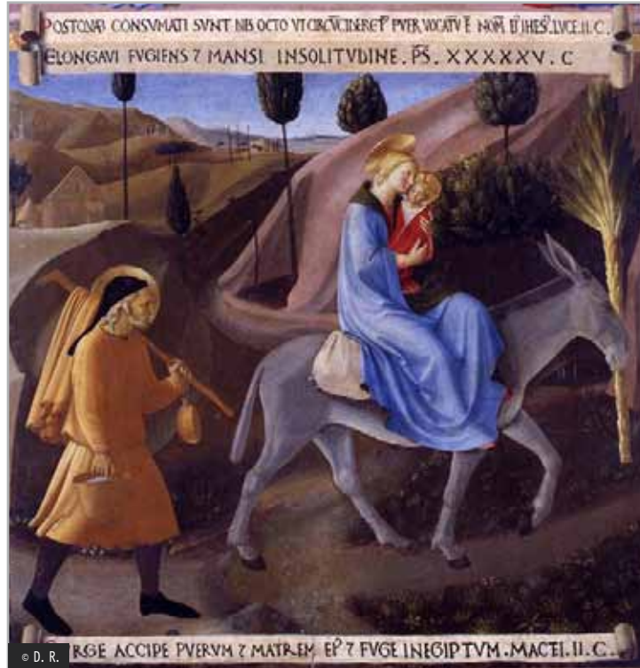
La Fuite en Égypte, Fra Angelico, Musée national San Marco.