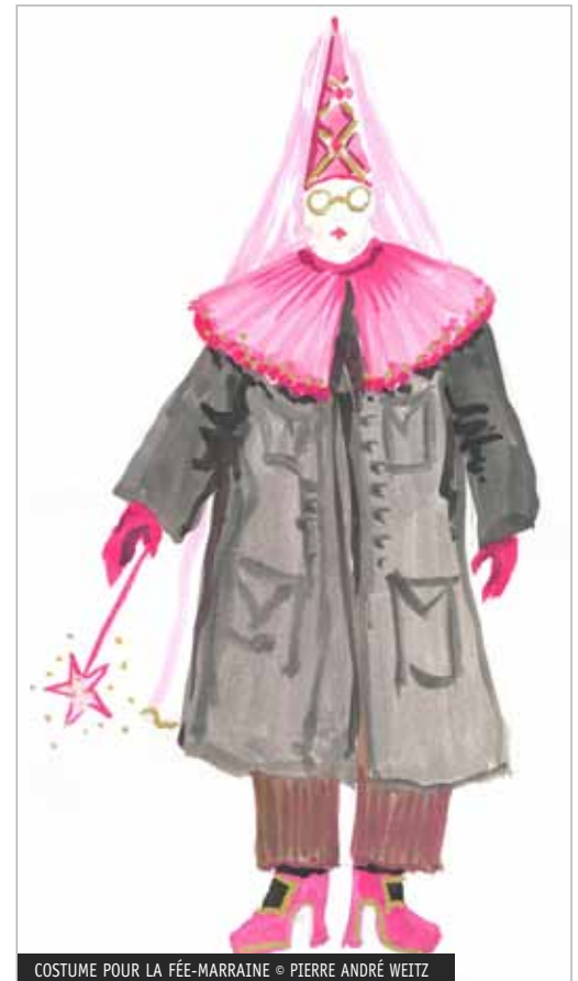
COSTUME POUR LA FÉE-MARRAINE © PIERRE ANDRÉ WEITZ

→ Demander aux élèves ce qu'ils pensent de ce costume proposé pour la fée-marraine.