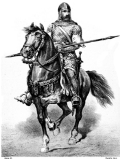
EL CID CAMPEADOR

→ A la lecture du résumé, comment vous imaginez-vous les personnages principaux que sont Le Cid et Chimène ?