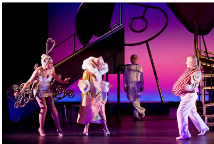
La meneuse de revue, Odette, le bourgeois. À l'arrière-scène, Arthur Cravan.