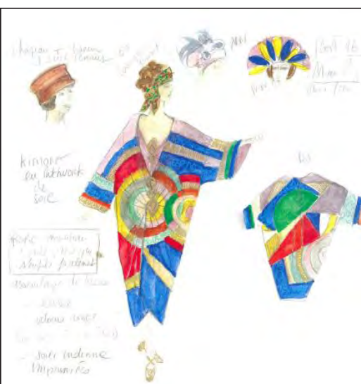
Croquis pour le costume de Mina Loy.

Les quatre critiques soulignent le décalage entre ce que l'on attend traditionnellement d'une revue et le spectacle proposé : « Jean-Michel Ribes n'a pas voulu faire de sa "revu(e)" dadaïste une simple farce burlesque » ; « On ne rit pas dans la nouvelle revu(e) de Jean-Michel Ribes. Tout simplement parce qu'elle n'est pas faite pour cela » ; « L'attrait désenchanté, un rien funèbre, de cette "ribienne" revue », autant d'expressions qui mettent en évidence le détournement opéré par le spectacle d'une forme traditionnellement dévolue à la joie de vivre.