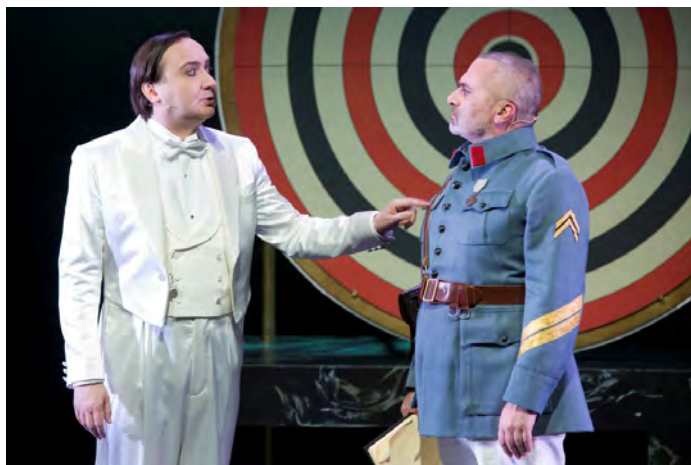
Arthur Cravan et le sergent recruteur.