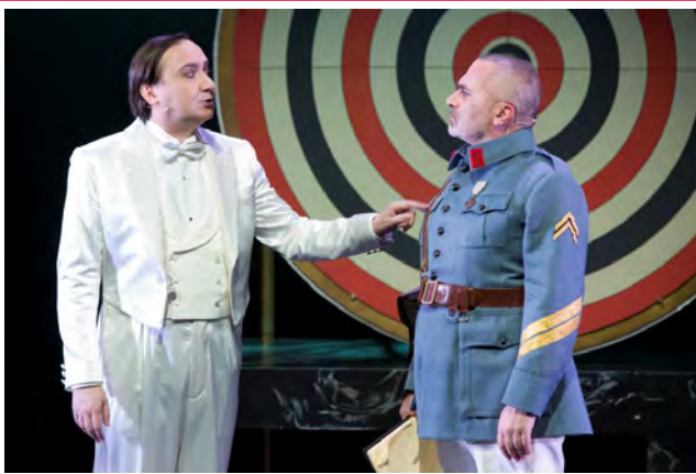
Cravan et le sergent recruteur.

Le jeu de regards entre les deux personnages témoigne de l'affrontement. Cravan inverse le rapport hiérarchique en donnant des ordres au sergent qui n'apprécie visiblement pas cette manière de faire.