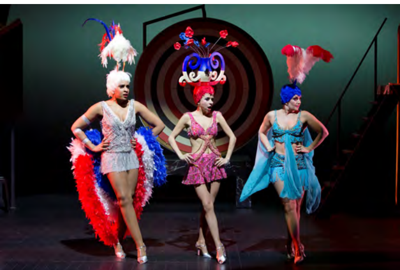
Arrivée des girls . Premier tableau: « La guerre ». © Giovanni Cittadini Cesi

Les girls et la meneuse de revue sont également présentes: leurs costumes renvoient aux années 1920, ils multiplient strass, plumes et paillettes, tout en laissant les jeunes femmes assez dénudées: l'érotisme fait partie de l'univers du music-hall.