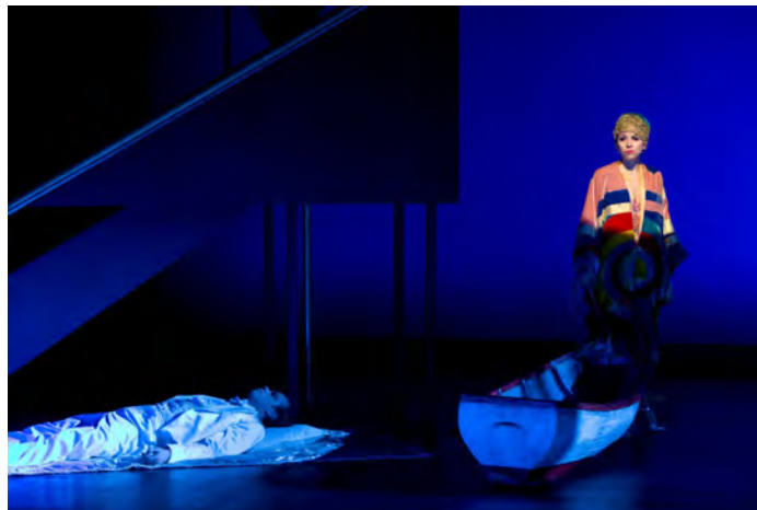
Jacques Rigaut et Mina Loy.