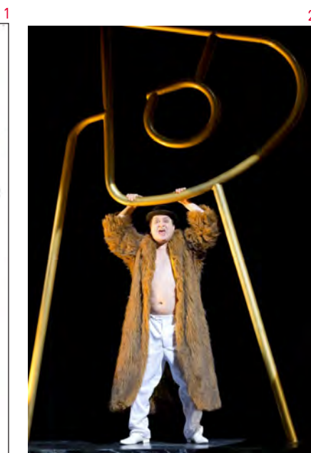
1: Croquis pour le costume de Thomas Barber.