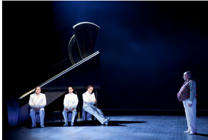
Arthur Cravan, Jacques Vaché, Jacques Rigaut et l'acteur/le bourgeois.