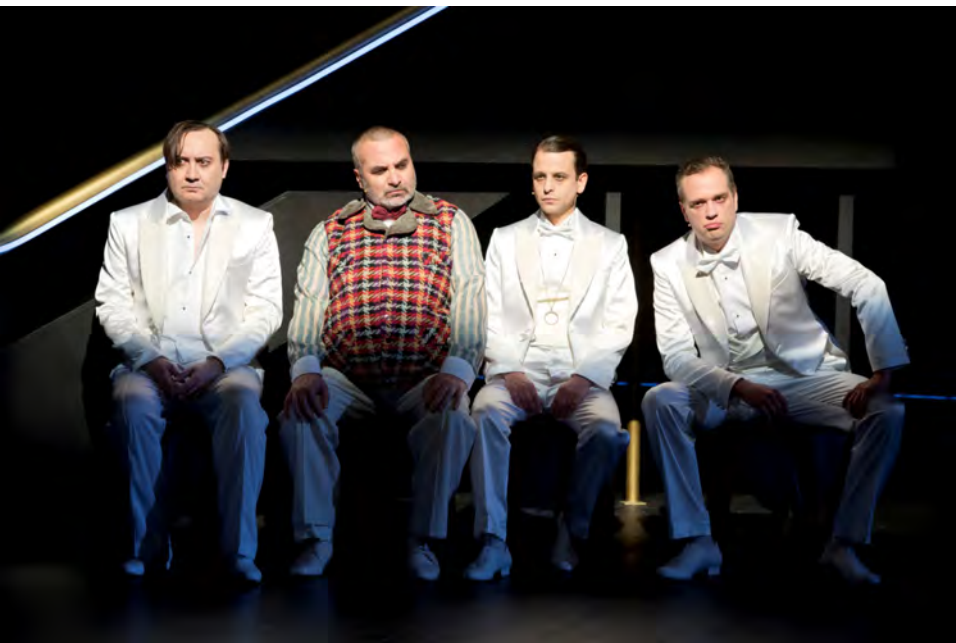
Arthur Cravan, le bourgeois, Jacques Vaché, Jacques Rigaut. Quatrième tableau: « L'ennui ».

Mais la mise en scène souligne cruellement la solitude des personnages: à aucun moment ils ne « jouent » ensemble, ils évoluent parallèlement sur le plateau, souvent isolés les uns des autres par la lumière. S'il est vrai qu'ils ne se sont jamais rencontrés, ils ont partagé leurs combats et leurs convictions avec d'autres (Vaché a connu André Breton, Rigaut a participé aux premières manifestations dadaïstes et surréalistes, Cravan était ami avec Cendrars, Van Dongen, Picabia ou Duchamp). Le spectacle de Jean-Michel Ribes choisit d'accentuer leur isolement: dans le monde, ils ne rencontrent aucun allié, seulement des adversaires ou des imbéciles.